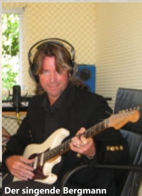
Der singende Bergmann